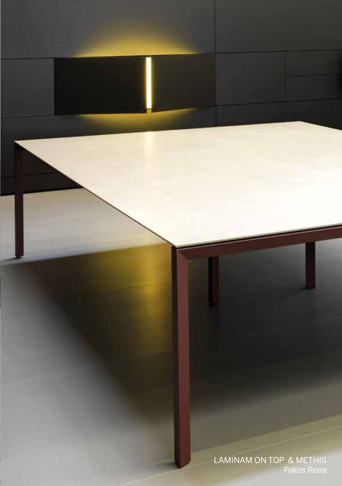
LAMINAM ON TOP & METHIS Fokos Rena