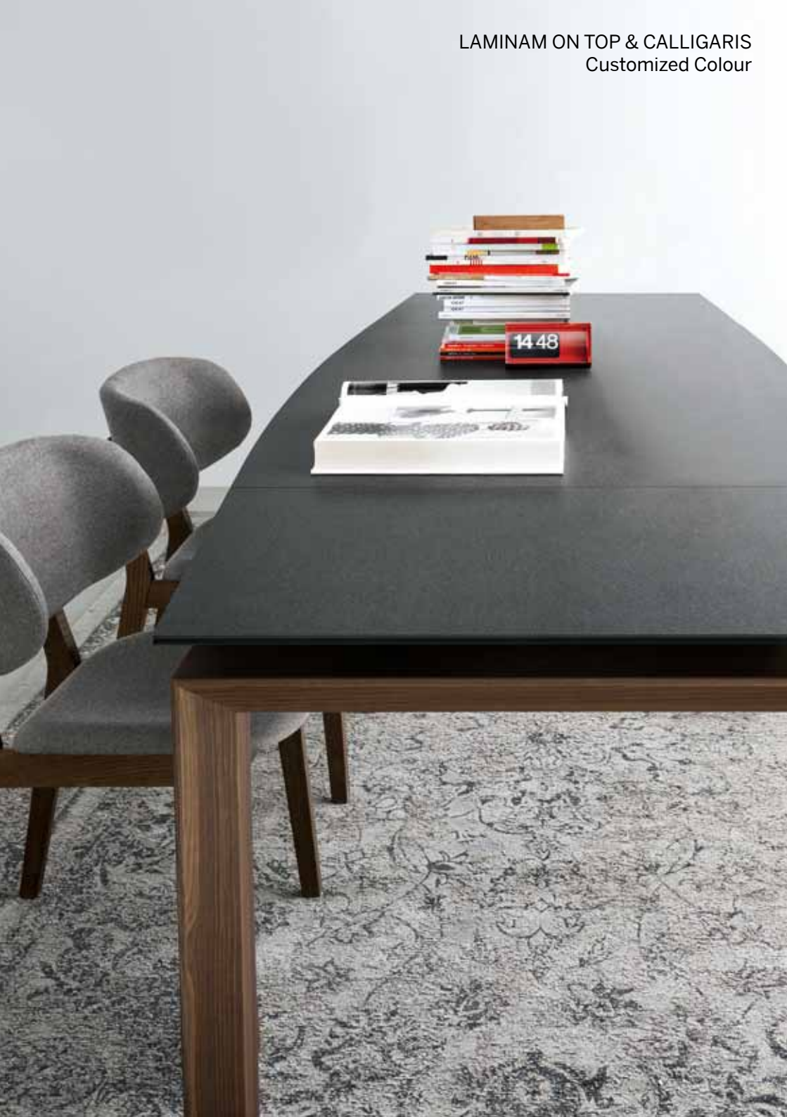
LAMINAM ON TOP & CALLIGARIS Customized Colour