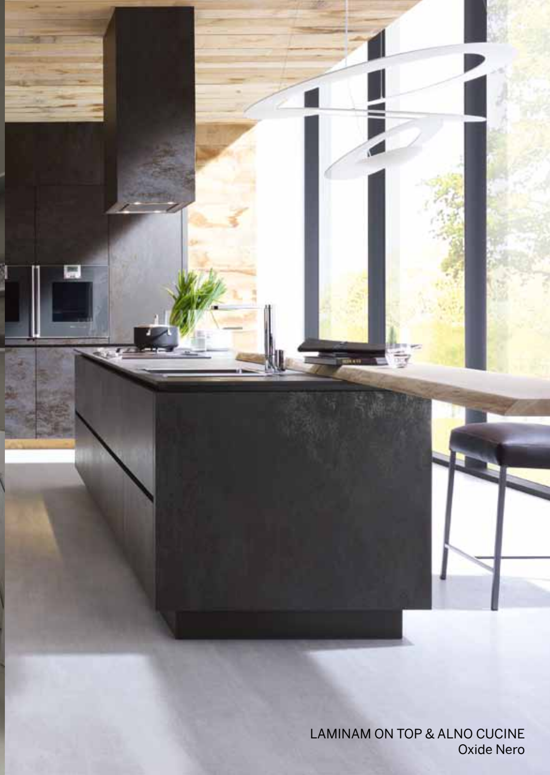
LAMINAM ON TOP & ALNO CUCINE Oxide Nero