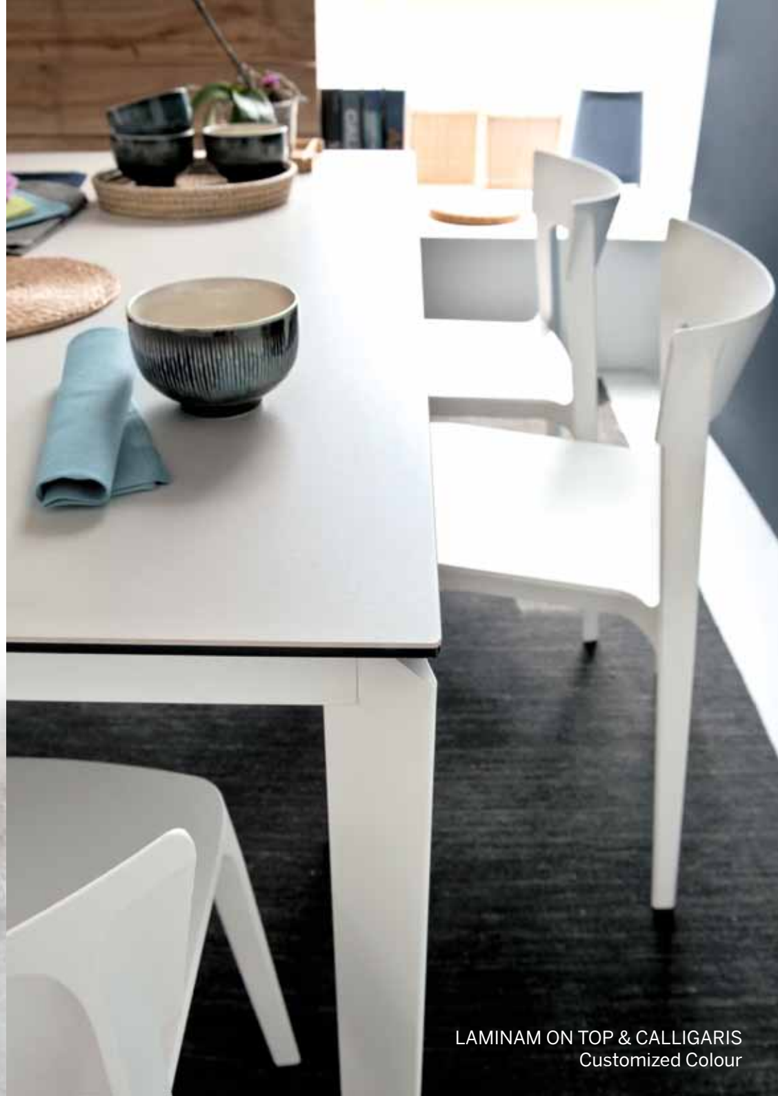
LAMINAM ON TOP & CALLIGARIS Customized Colour