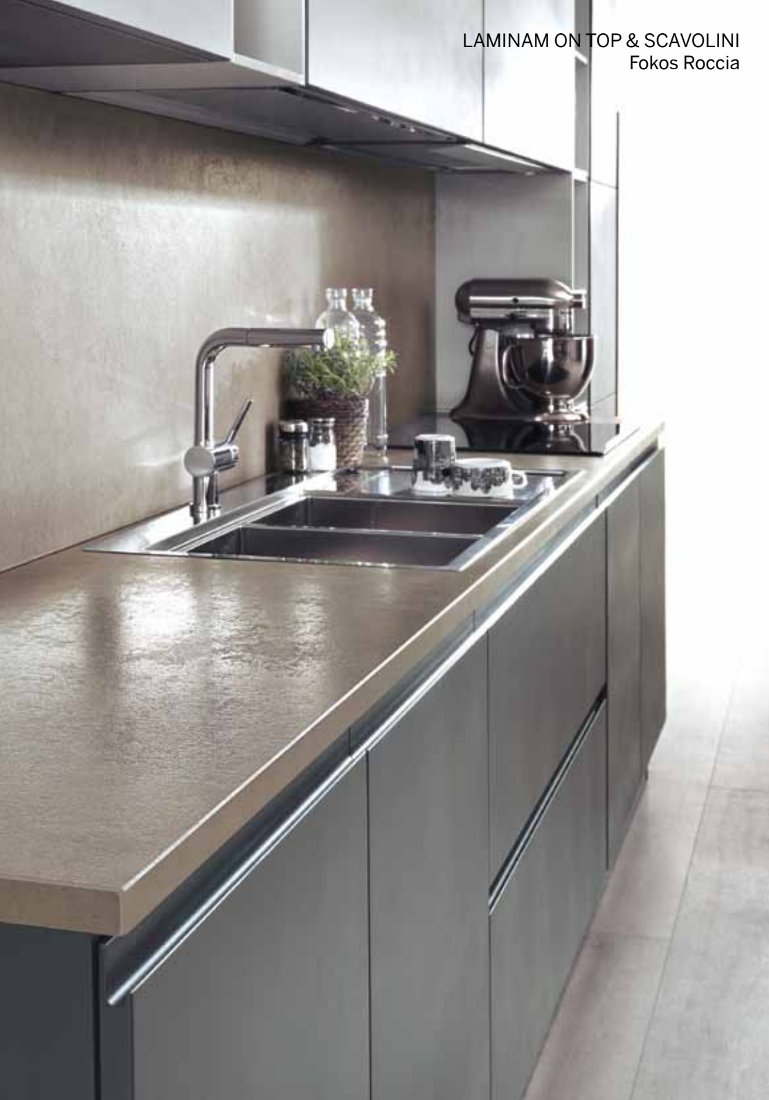
LAMINAM ON TOP & SCAVOLINI Fokos Roccia